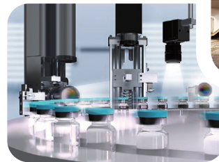
▽ AOI (自動光学検査)