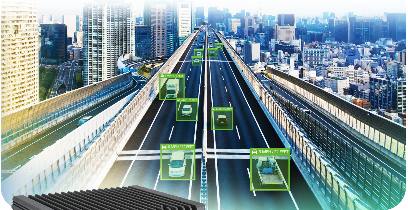
△ トラフィックビジョン

NVIDIA® Jetson Orin™ NX/Nano 搭載 手軽に導入可能な小型 AI コンピューティング