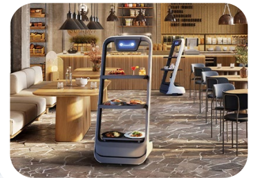
△ 自動配送ロボット